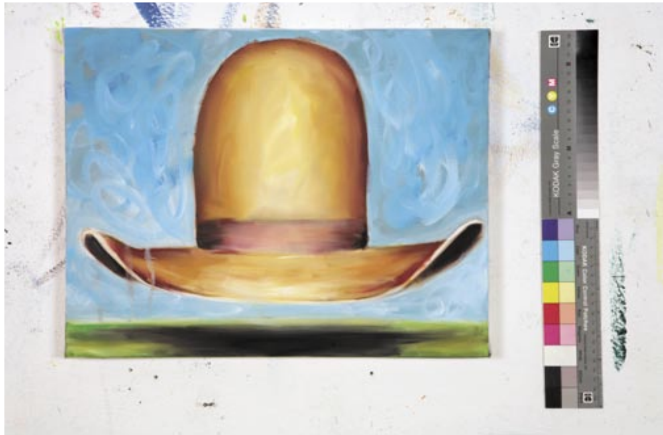
Ufo , 2006, Öl/Leinen 50 x 50 cm