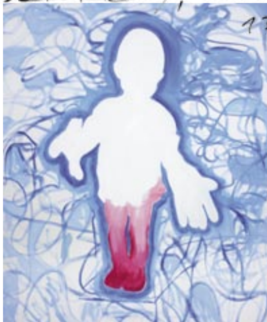
Handschuhgeist , 2006, Öl/Leinen 102 x 85 cm