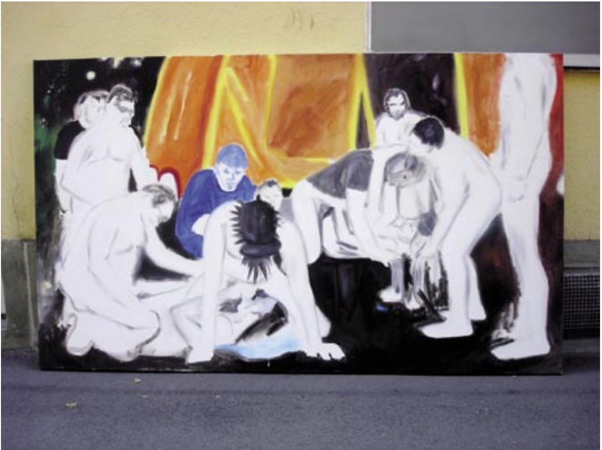
Blue boy , 2005, Öl/Leinen 120 x 200 cm