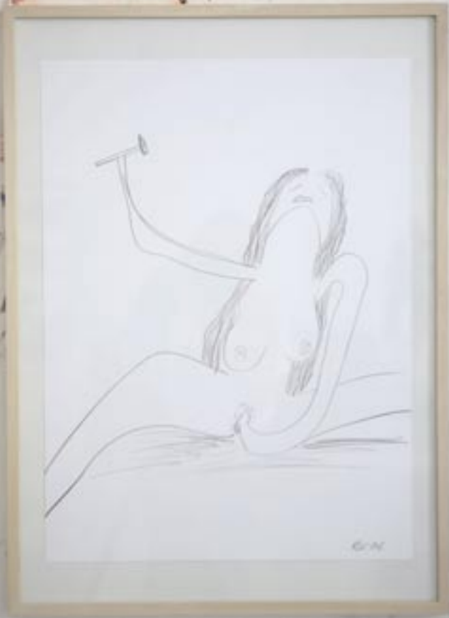
Hammerfrau , 2005, 63 x 44 cm