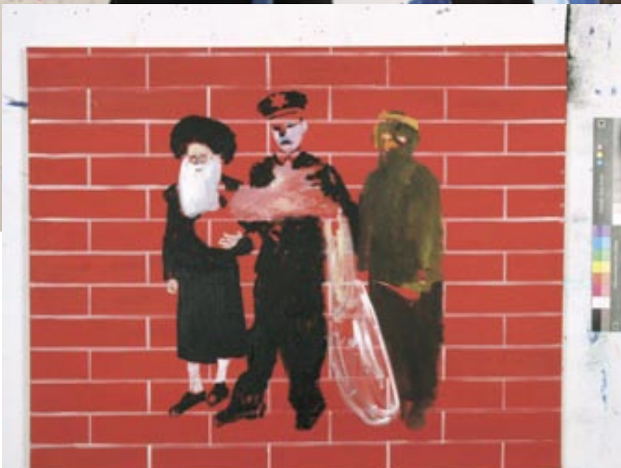
Wedding present , 2005, Öl/Leinen 80 x 100 cm

WEDDING PRESENT, 2005, ÖL/CANVAS 160 x 180 cm, 80 x 100 cm