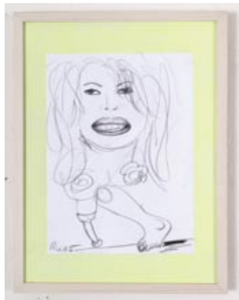
Bissi schüchtern , 2005, 20 x 30 cm