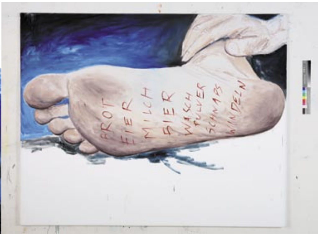
Fussnoten , 2005, Öl/Leinen 120 x 90 cm