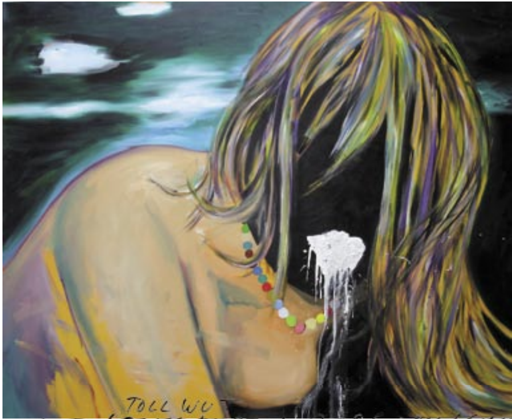
TOLL WUT O.T. (GERTJAN KOOIJMAN), 2006, OIL/CANVAS Tollwut , 2006, Öl/Leinen 130 x 160 cm