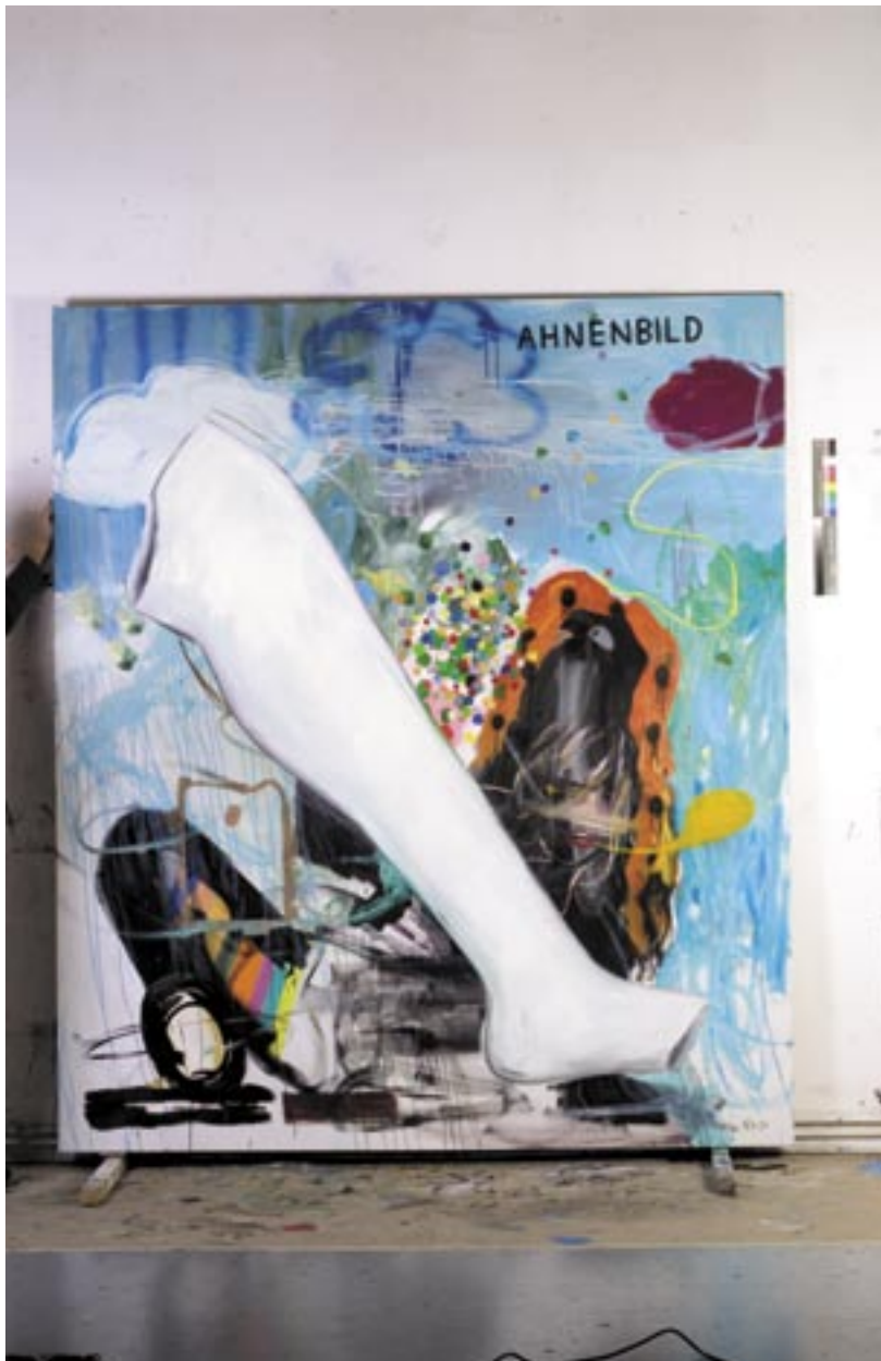
Ahnenbild I , 2006, Öl/Leinen 220 x 190 cm

AHNENBILD I, 2006, Öl/Leinen, 220 x 190 cm