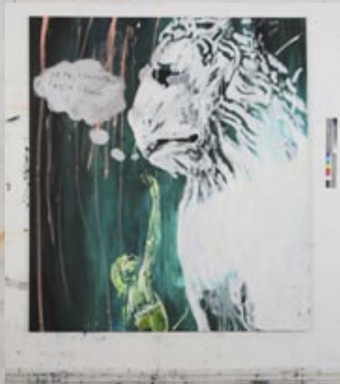
Do you love me? . 2005, Öl/Leinen 180 x 160 cm

DO YOU LOVE ME?, 2005, Öl/Leinen 180 x 160 cm