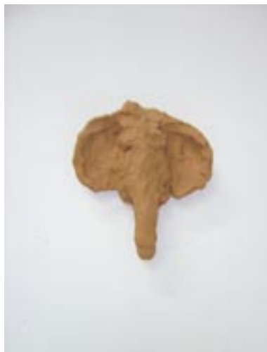
O.T. (Elefant) , Ton, ca. 30 x 26 x 4cm