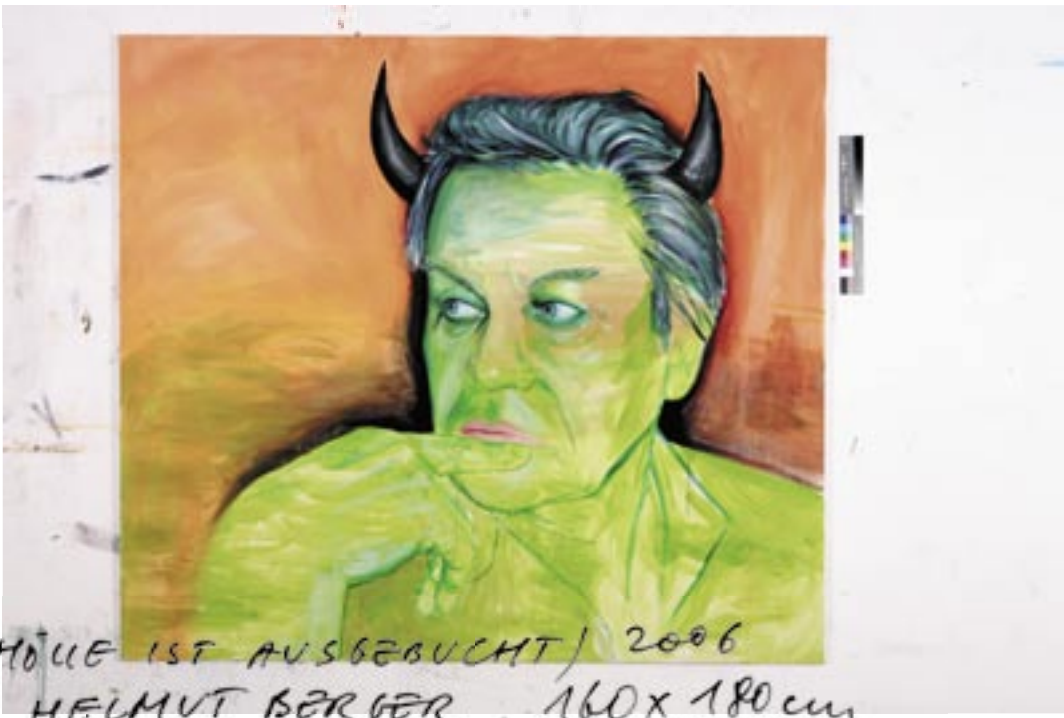
BEI (DIE HÖLLE IST AUSGEBUCHT) 2006 PORTRAIT HELMUT BERGER 160x180cm