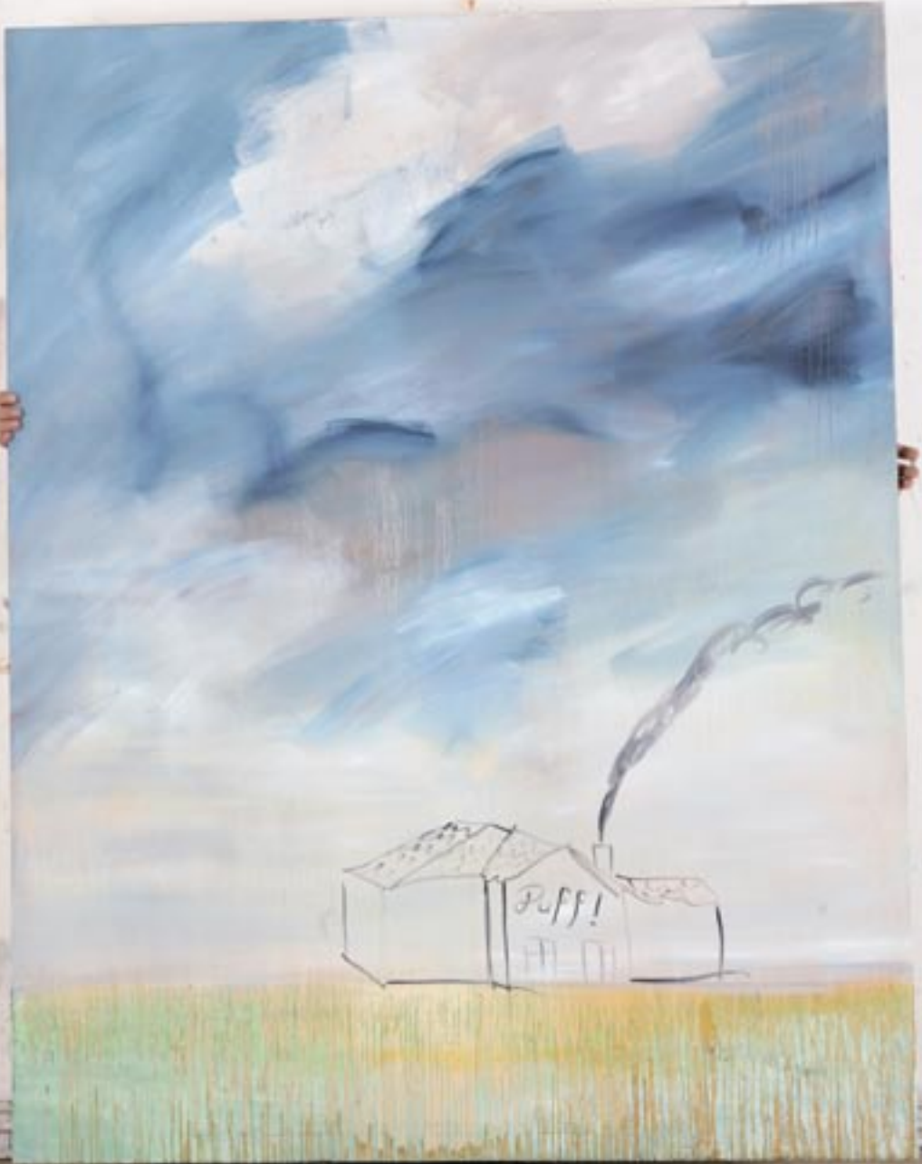
Puff , 2005, Öl/Leinen 180 x 140 cm