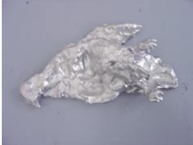
O.T. (Tauben) , Ton, lackiert, 33 x 17 x 9cm