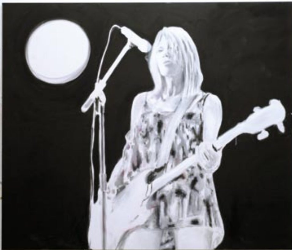
I believe your lies , 2006, Öl/Leinen 170 x 200 cm