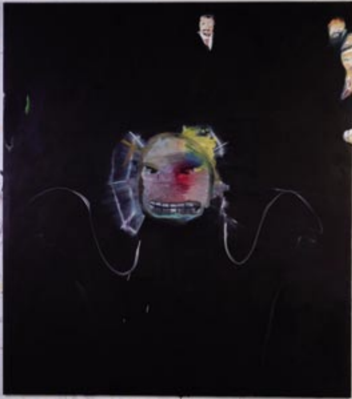
Was denkt sich dieser Geist? , 2006, Öl/Leinen 180 x 160 cm

WAS DENKT SICH DIESER GEIST? ÖL / Leinen, 2006, 180 x 160 cm