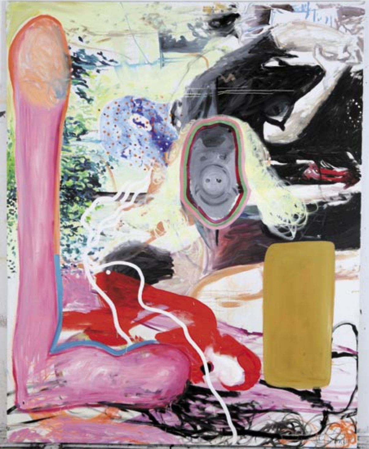
Ocker , 2006, Öl/Leinen 160 x 200 cm

Handwritten notes in German: Ocker, 2006, Öl/Leinen 160 x 200 cm Karte, 2006, Öl/Leinen 160 x 200 cm