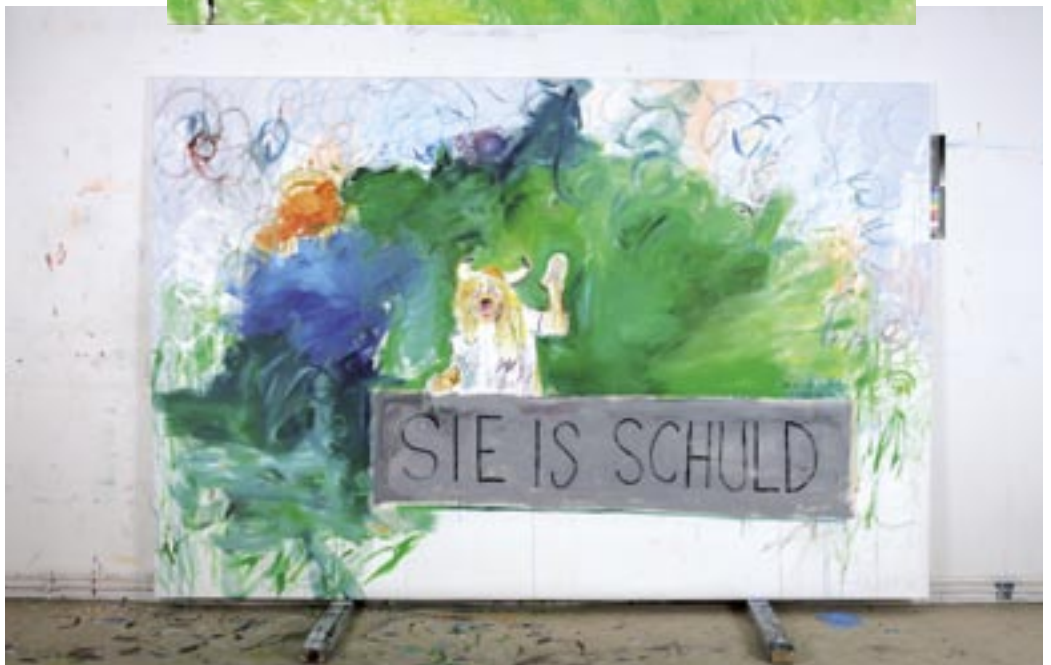
Sie is schuld , oben, 2006, Öl/Leinen 220 x 190 cm , unten, 2005, Öl/Leinen 200 x 300 cm

SIE IS SCHULD OBEN: 2006, ÖL/CANVAS, UNTEN: 2005, — " — , 200 x 300 cm