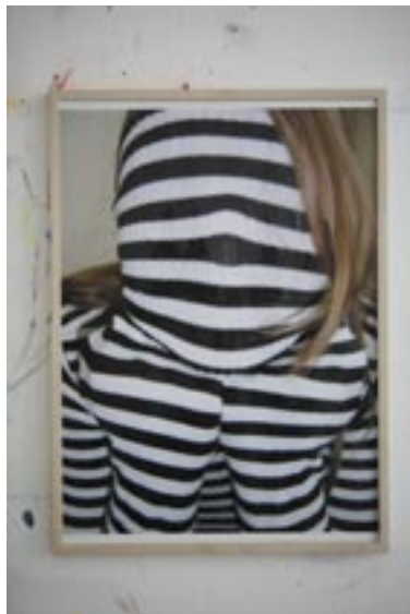
O.T. (Nathalie) , 2004, Foto, Unikat 70 x 50 cm