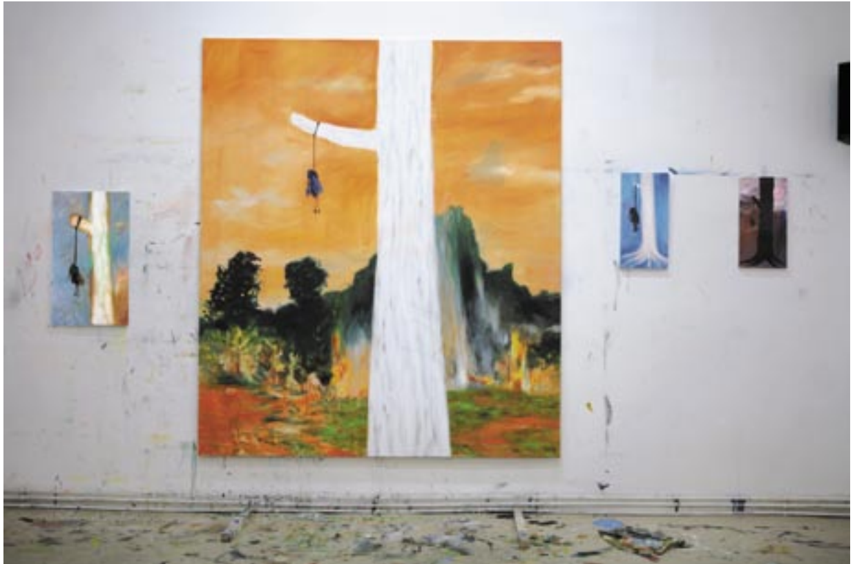
Monkeybusiness in der Vogelwelt , 2006, Öl/Leinen, Maße variabel