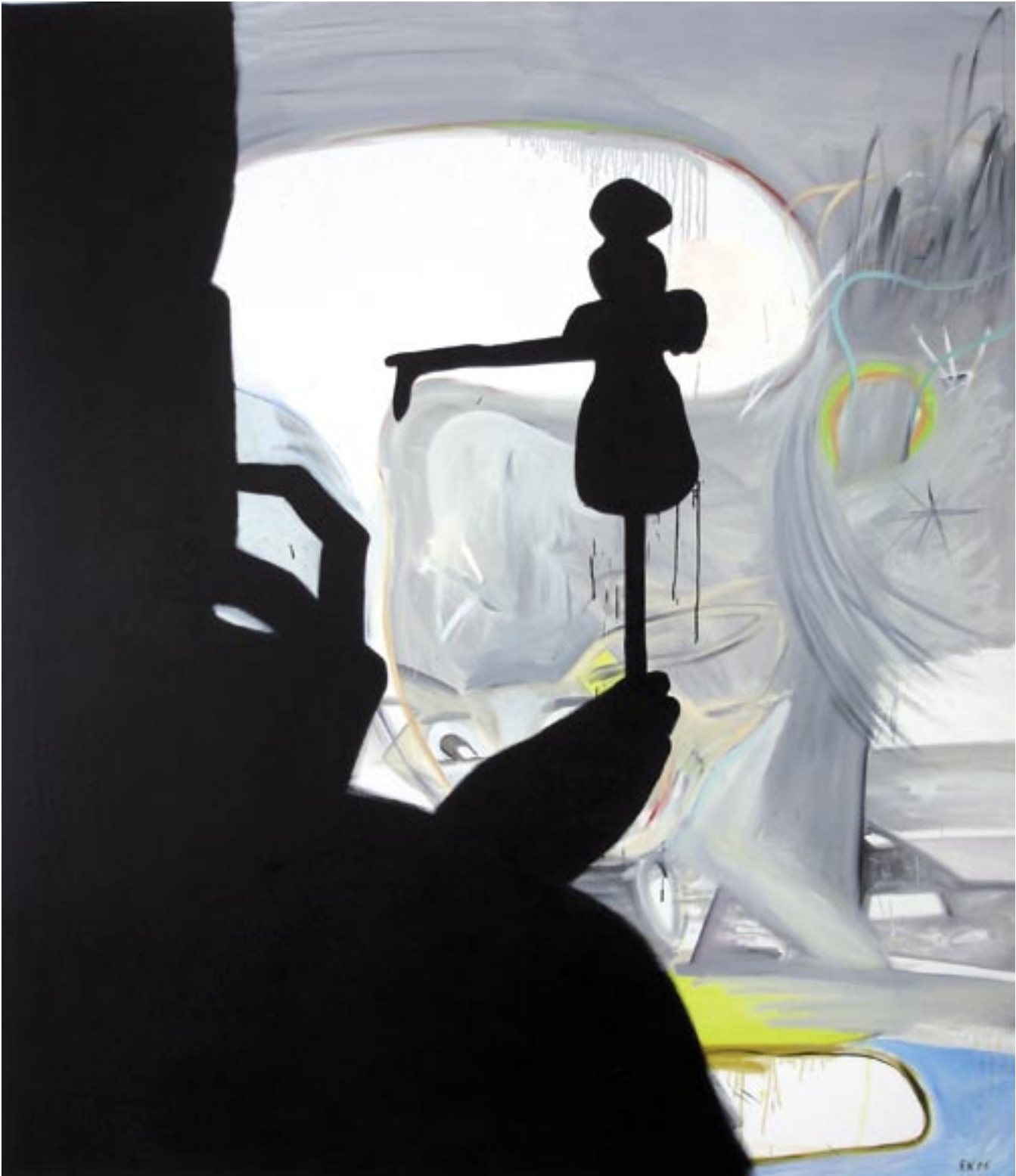
Menschenspiel , 2006, Öl/Leinen 220 x 190 cm

MENSCHENSPIEL, 2006, OIL/CANVAS, 220 x 190 cm