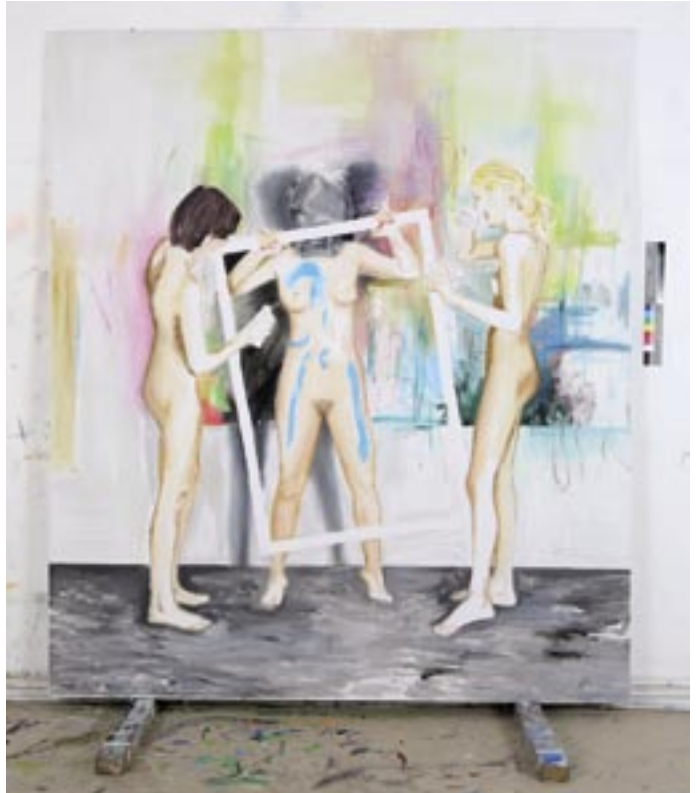
Rahmenhandlung , 2006, Öl/Leinen 220 x 190 cm