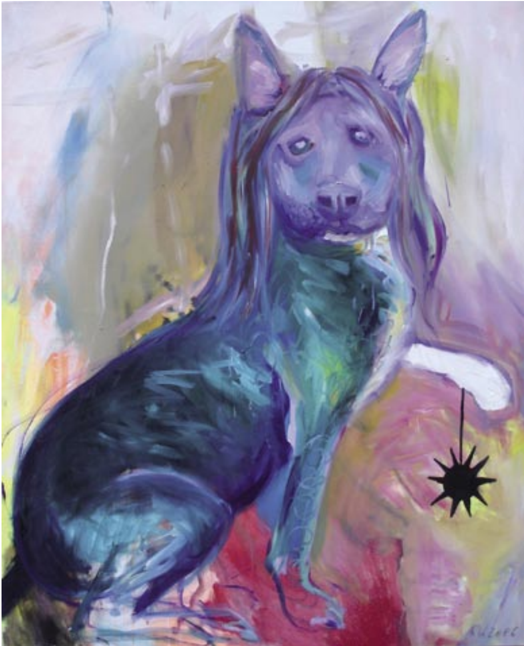
AMNENBILD II, 2006, Öl/Leinen, 110 x 90 cm