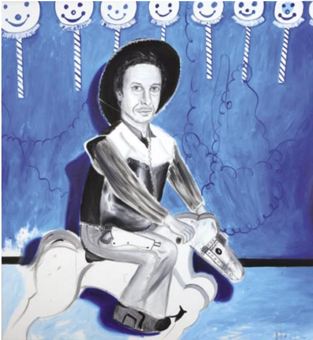
COWBOY, 2005, ÖL/CANVAS, 220 x 200